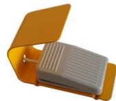
Pedal con protector