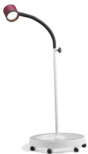
Lámpara de fototerapia (opcional)