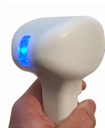
Manípulo con indicador de funcionamiento

Finalmente Laserlight se lanza al mercado con el nuevo láser de diodo Deep Infnit . Con la nueva tecnología V·LED con chips de alto rendimiento. Con un mínimo de 30 MILLONES de disparos garantizados por escrito y sin mantenimiento. Apto para cualquier fototipo de piel incluso para pieles bronceadas. Indoloro y muy efectivo. Sistema pulso a pulso o en modo barrido hasta 15 Hz.