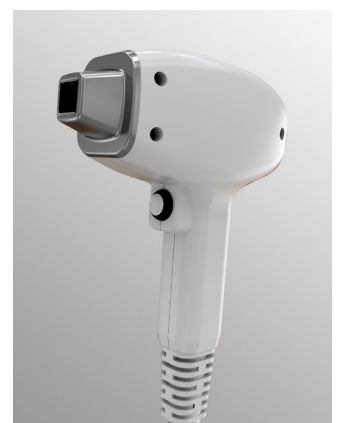
Manípulo ergonómico con punta de zafiro y refrigeración hasta -10°