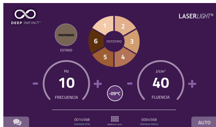
Menú de usuario preestablecidos o valores para usuarios experimentados